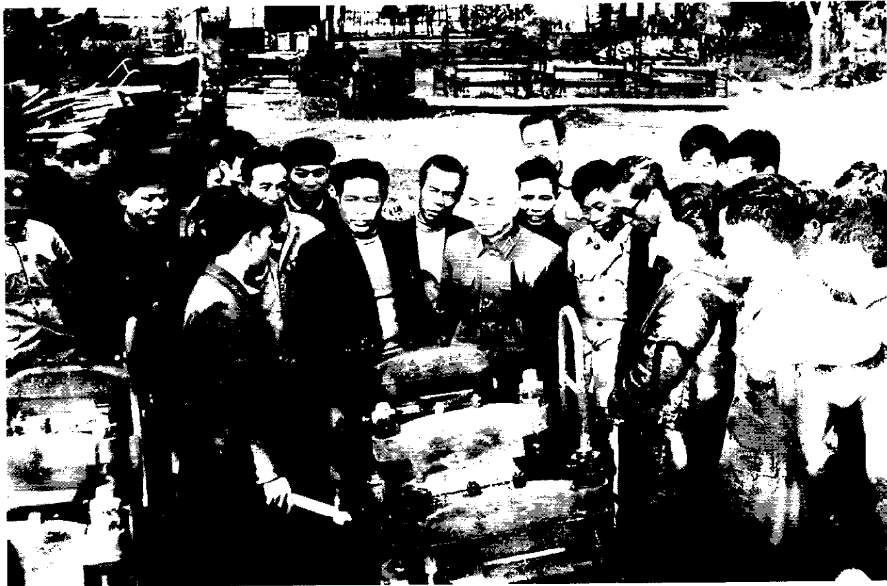
Đại tướng Võ Nguyên Giáp thăm phân xưởng sản xuất của Nhà máy cơ khí Hà Nam.